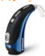
ナイーダ S SP (スーパーパワータイプ)