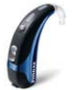
ナイーダ S UP (ウルトラパワータイプ)