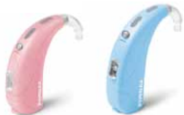
高度難聴用 ナイダ S I SP-W 重度難聴用 ナイダ S I UP