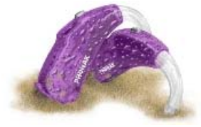
<ハウジングカラー> スケルトンパープル(38)