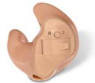
ITE 13 UZ UP

なお、UPを選択できる器種は、フォナック アンブラ13 UZ、ソラナ13 UZ、カッシーア13 UZの3器種で、適合聴力レベルは中等度～重度難聴となっております。