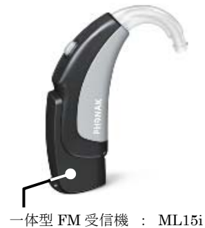
一体型 FM 受信機 : ML15i