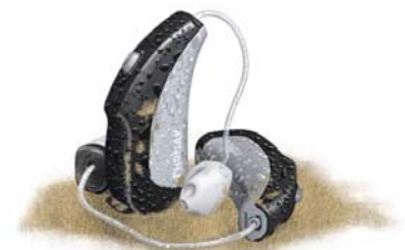
＜ハウジングカラー＞ パラジウムブラック(70)