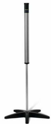
線音源スピーカー デジマスター5000